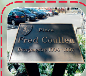
Im Zentrum der Umgestaltungsmaßnahmen: der Place Fred Coullen in Kayl